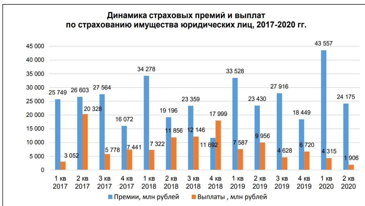
Рисунок 1. Динамика страховых премий и выплат по страхованию имущества юридических лиц, 2017-2020 гг.

Источник: Страховой сектор: задачи сегодняшнего дня и прогнозы. Deloitte.URL: https://www2.deloitte.com/content/dam/Deloitte/ru/Documents/tax/not-home-alone/insurance.pdf (дата обращения: 01.10.2021).